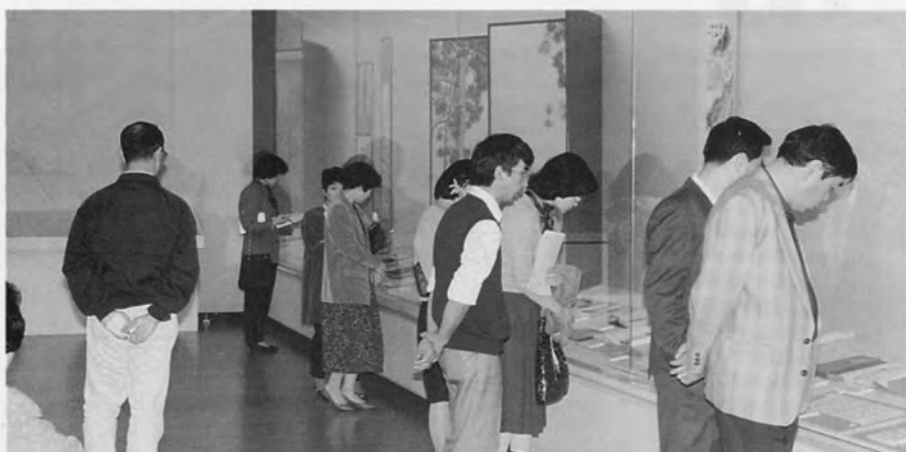
「湘南の文学と美術」展