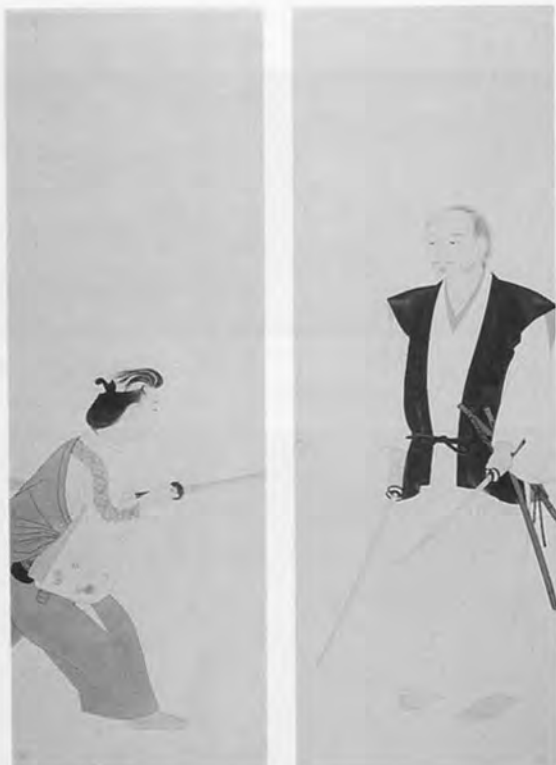
安田毅彦 宮本二天像 1933年