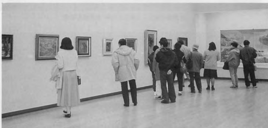
本荘 起 回顧展