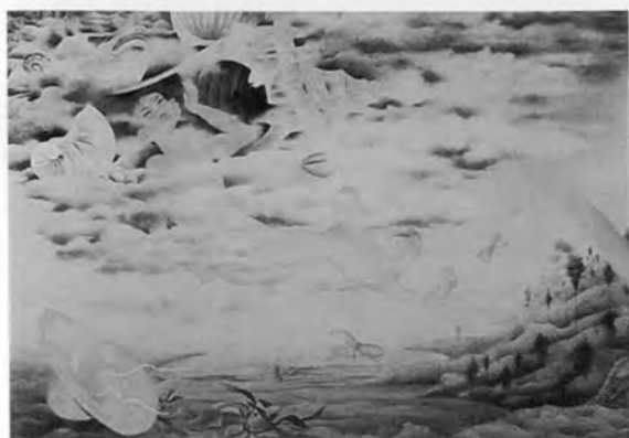
工藤甲人 次郎雲 1970年