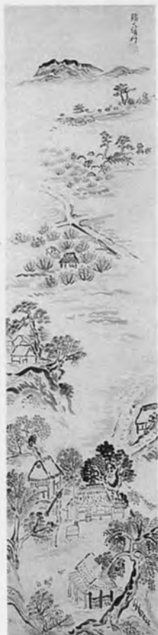
萬鐵五郎 風景 茅ヶ崎時代