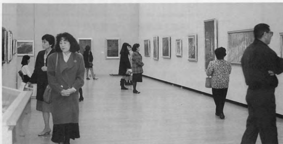
本荘 赴 回顧展