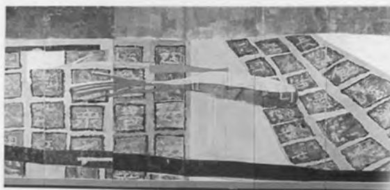
井上三綱 泰山石刻 1972年