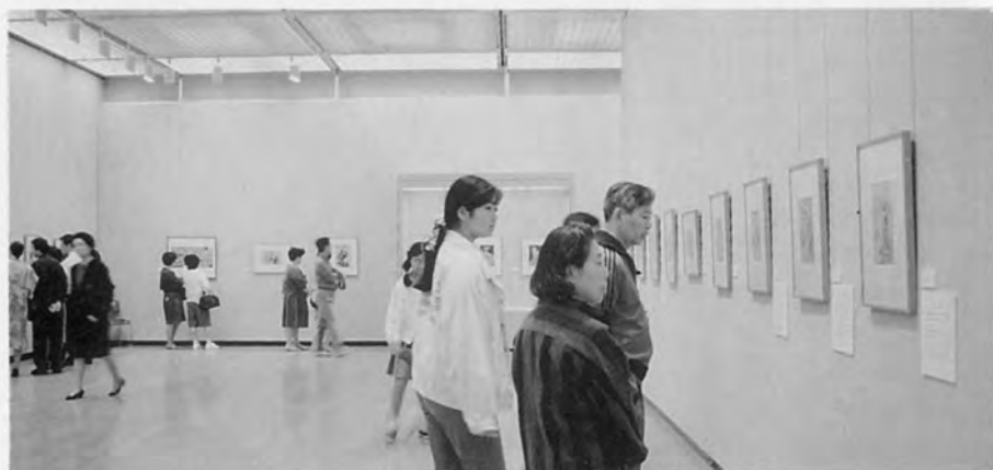
浮世絵百年の名作展