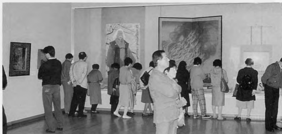
「湘南の文学と美術」展