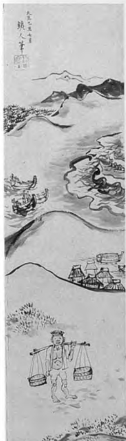
萬鐵五郎 茅ヶ崎風景 1925年