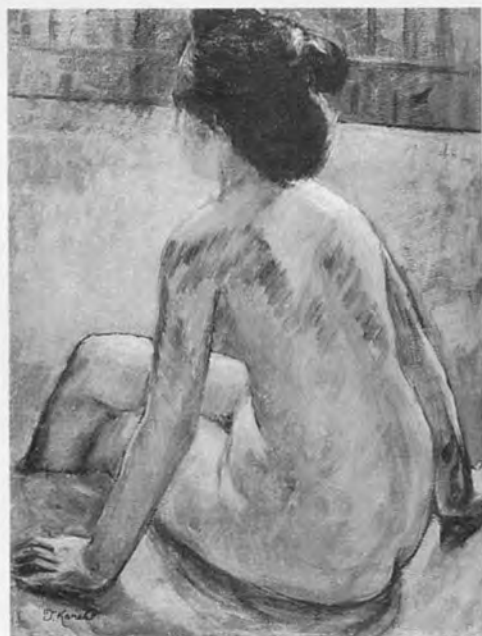
金子保 裸婦 1928年