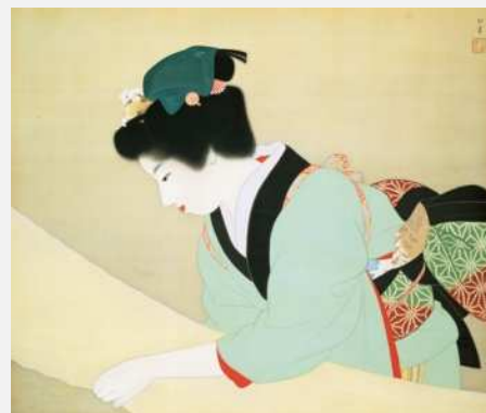
上村松園 晴日 1941年