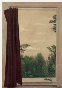
長谷川湊二郎《窓とかまきり》1930年、個人蔵