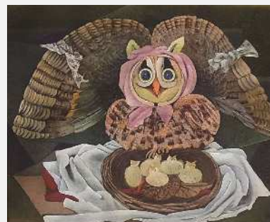
桂ゆき《みみずく》1947-48年