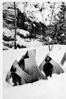
ホンヤラ洞にゆく子供たち 1956年、当館蔵