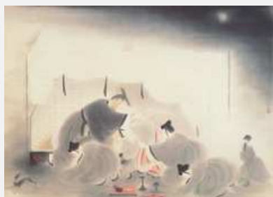
安田鞠彦《日食》1925年 当館蔵