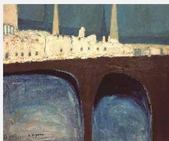
菅野圭介《哲学の橋(ハイデルベルク)》1953年 梅野コレクション