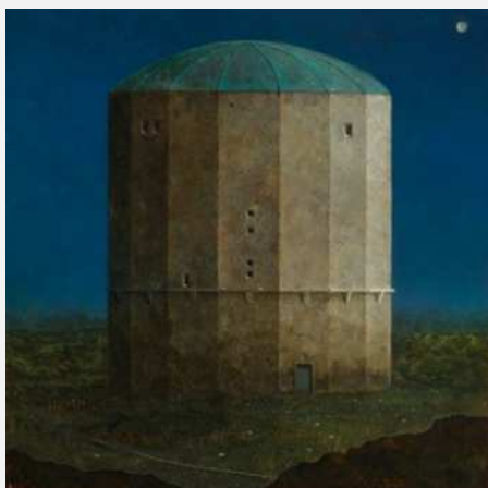
《つぎの日の朝の風景》1992年