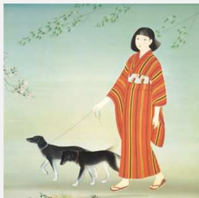
菊池契月 散策 1934年