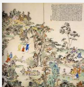
河野通勢《桃源郷に遊ぶ人々》1941-42年頃 当館寄託