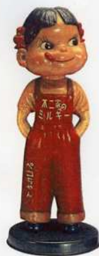
ペコちゃん人形 1959年頃