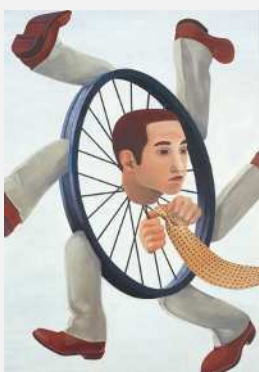
石田徹也 大車輪 1995年、当館寄託