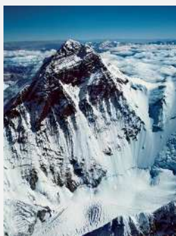
エヴェレスト山,ネパール,地の貌 1974年