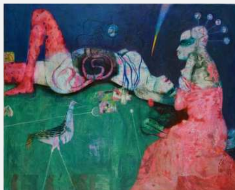
佐々木豊 悪い夢 1974年、当館蔵