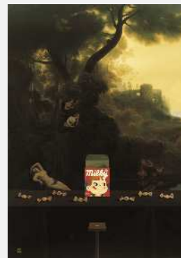
渡部満 不在の時間 ペコのいる風景 2009年