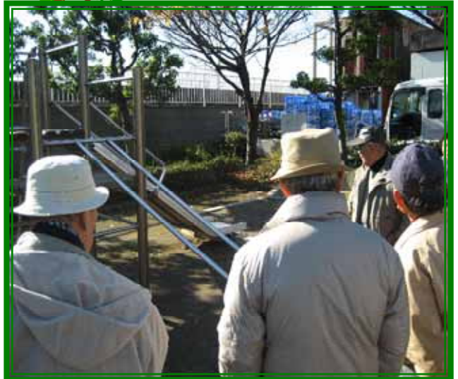
朝霧公園は馬入川のすぐ横。 当日はお天気も最高でした。