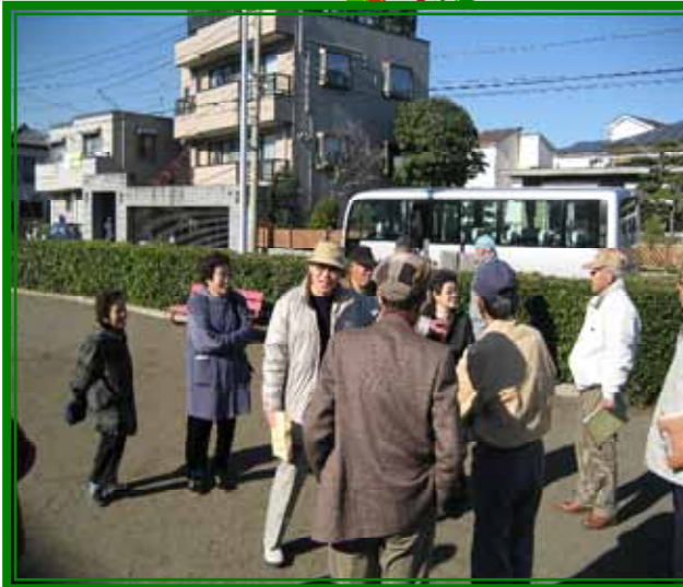
水道や花壇の敷設等何でも会員の手で こなしてしまう龍城ヶ丘公園。