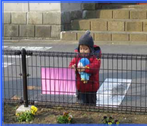
小さい頃から愛護活動に参加している会員。