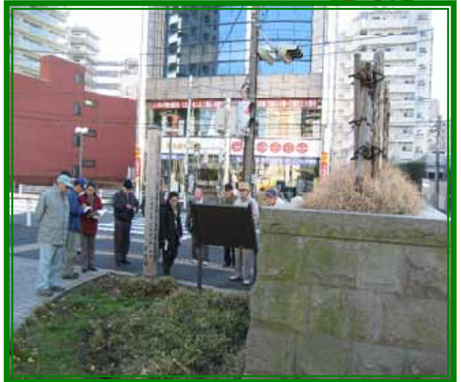
見附台緑地・江戸見附緑地は 東海道平塚宿の顔となるスポーツ