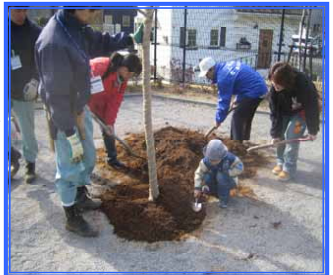
自治会の方々や地域の子ども達、お母さん方も参加しての植樹。

めぐみが丘公園愛護会は、平成17年9月1日設立という現在ある愛護会の中でもとても新しい愛護会です。会員数は59名で、めぐみが丘公園をお世話してくださっています。めぐみが丘公園は約1.17haと面積が広く、2つの大小の広場と樹林地があり、その中を散策路が通っていて自然の景観を味わえるようになっており、市内の公園の中でもあまり例のない作りです。活動内容は定期的な清掃、除草と施設点検を行っています。最近では大きい広場の中に花の咲く樹木として鬱金（ウコン）桜を植える試みも行われ、市の職員とともに大勢の地元の方に参加していただきました。また、めぐみが丘の地域は地区計画区域に決定されていて、自然と調和した快適なまちづくりという理念に基づき、地域の協議会とともにまちづくりを進めている地域です。防犯の意識も兼ねて、夜間のイルミネーションにも力を入れており、夜になるときれいな家並が一層美しくきわだって見えます。