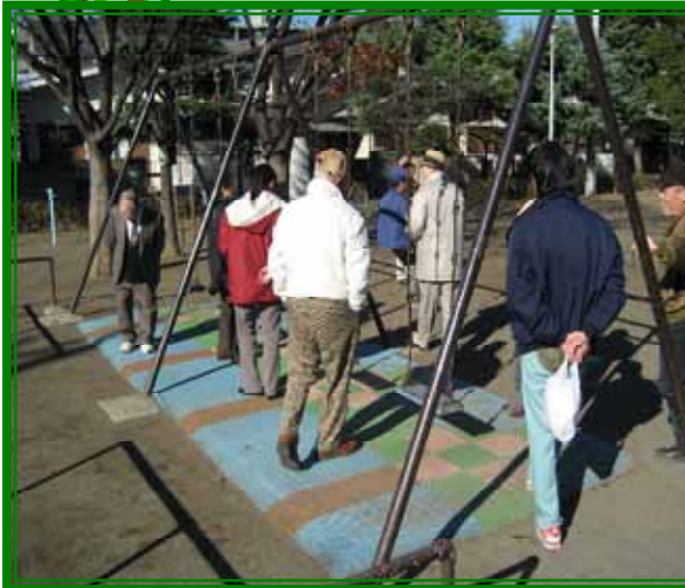
羽衣公園は遊具がいっぱい。 桃浜町にあるんですよ。