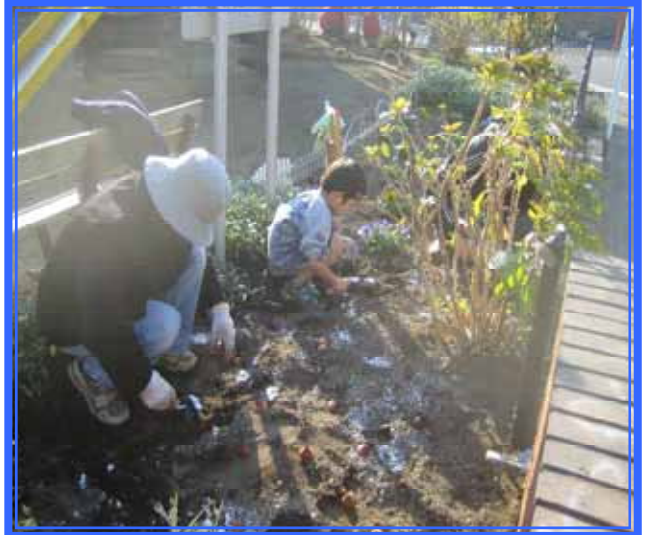
黙々と球根を植え続けます。春が楽しみ…。