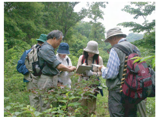
野外での生物の調査