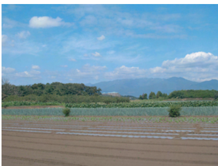
景観 遠藤原から北西方向を望む 2005年9月17日撮影