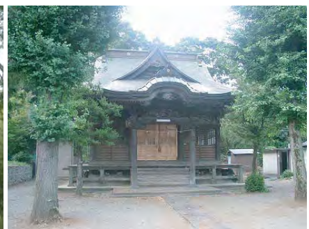
人文 熊野神社 2005年7月21日撮影