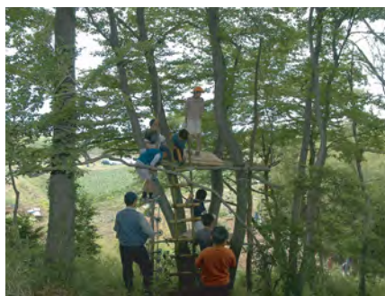
人とのふれあい 自然観察場所 2005年6月5日撮影