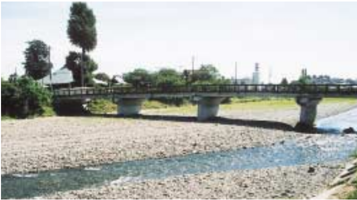
かなめがわ かなのんぼし 金目川と観音橋