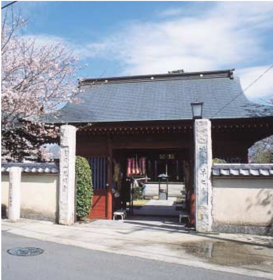
演説会が開かれた金目観音堂

ました。そして、勉強会や演説会な どをしたそうです。 この運動によって、明治十四年 （一八八二年）十月、明治政府は、 憲法の制定と国会の開設を明治二十 二年（一八八九年）にすることを 約束しました。