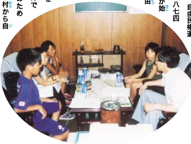
じ ゆうみんけんうんどう うんどう 「自由民権運動」ってどんな運動ですか？

では、なぜそのよ うな運動をしたので しょうか。それは、 明治時代の初めは、国 民が国に対して意見を 言うことができませんで した。そこで、国民のため の憲法を作って、町や村から自