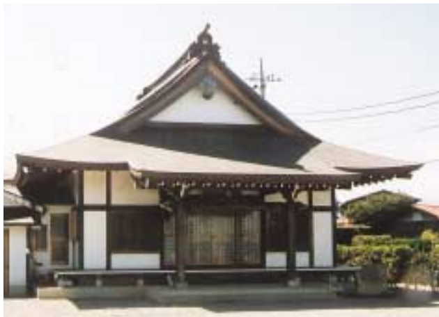
げんざいの ぞうしんじ (みなまかなめ)

かなめむらしょだいにそんちやう ひらつかまち だいちやうちやう 金目村初代村長、平塚町16代町長