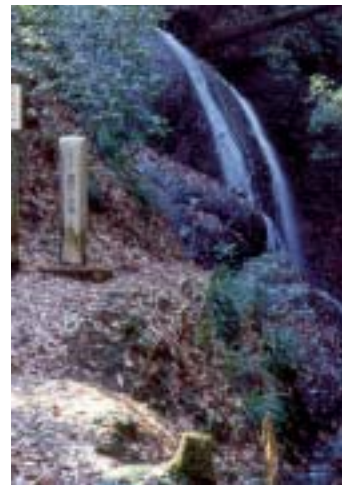
霧降りの滝・松岩寺