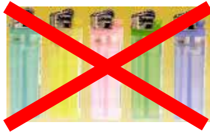
使い捨てライター