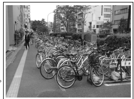
駅前大通りの路上駐輪