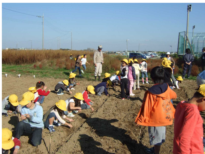
種まき作業の風景