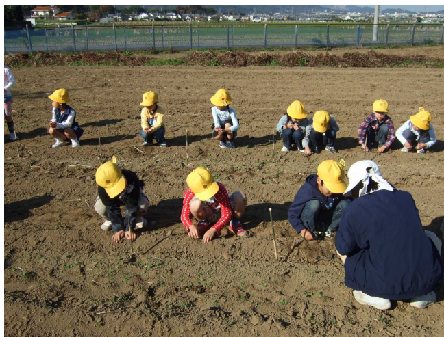
種まき作業の風景