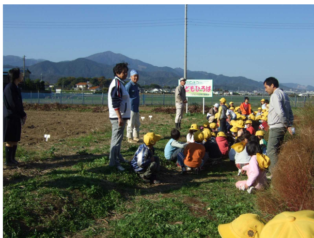
作業後、「菜の花」の話聞く様子