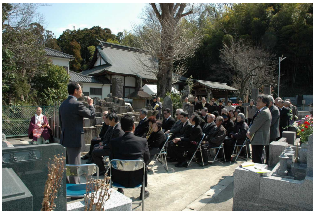
秋山博墓前祭の様子(平成18年度)

明治時代、金目の鍼医として多くの功績を残した「秋山博」。その生涯や遺徳を再認識してもらい、市内外に広く情報発信するため、今年も「秋山博墓前祭」を実施します。