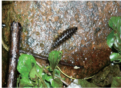
ホタル幼虫の上陸