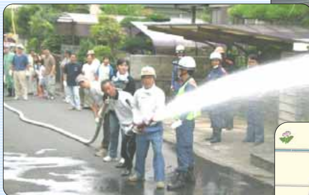
住宅密集地における住民参加による消火訓練