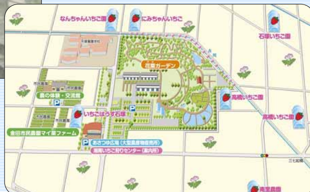
ひらつか花アグリ イメージ図