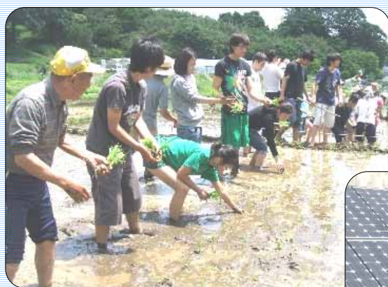
里山での田植え体験