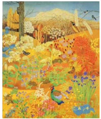
流れゆく山の季節／1990年

今回のひらつか〜な は、救急医療週間に合 わせ開催された「ひら つか救急フェア2010」 取材しました。 番組では、救急隊に よる現場活動のデモン ストレーション、心肺 蘇生法やAED(自動体 外式除細動器)の利用 方法を紹介しながら、 救急救命医療の大切さ をお伝えします。