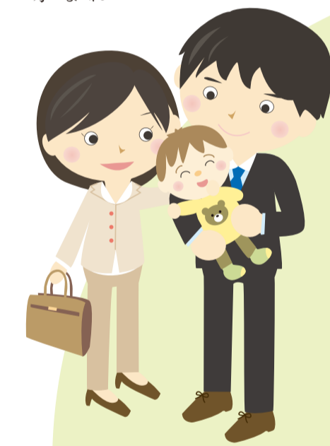
ワーク・ライフ・バランス

とその推進のための行動指針を国が策定し、官民が一体となってWLBの推進に取り組んできました。さらに施策の進捗よく状況や経済情勢の変化などを踏まえ、今年6月に憲章と行動指針が見直されました。新しい憲章では、デューセント・ワーク(働きたいのある人らしい仕事な