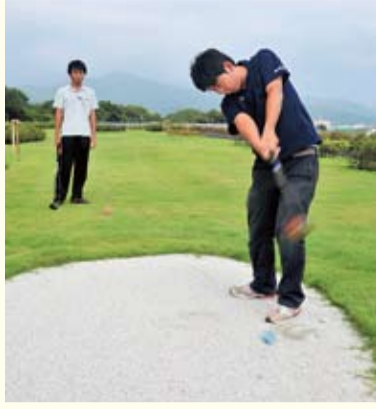
クラブ1本で気軽に楽しめます

パークゴルフは芝で覆われたコース内で、専用のクラブを使って直径6センチのプラスチックのボールを打ち、直径20センチのホールにカップインするまでの打数を競い合います。1ホールに3〜5のパー(標準打数)が設定されています。ゲームの単位は1ラウンド18ホールです。使用するクラブは1本で、コースは