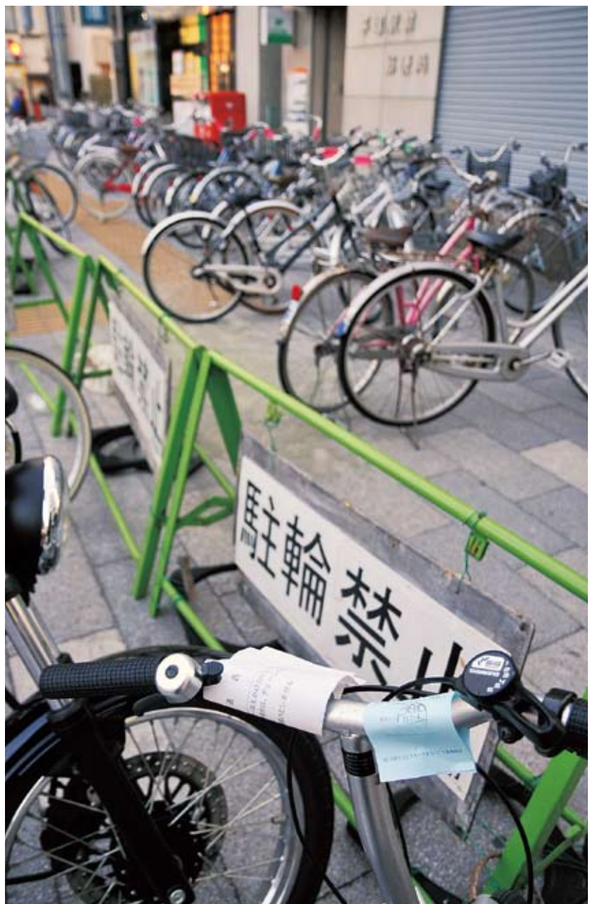
③ 駅南口の平塚駅前郵便局付近。写真奥では自転車が点字ブロックの上にもまで乗り上げているのが分かります。

に自転車が止まっているというものです。特に駐輪マナーが悪いのは、平塚駅前郵便局の前(右写真・地図③)と、東側のファストフード店の前です。市では駐輪禁止の札を立てたり、バリケードで違法駐輪をしないよう呼びかけたりしてはいるものの、バリケード自体を動かされてしまうこともあり、なかなか解消できていないのが現状です。特に夕方の混雑時は、点字ブロックを必要とする目の悪い方にとっては危険な状態になっています。