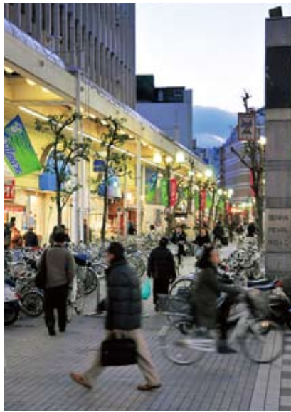
① 夕方の5時頃はまるで自転車の洪水です。

強。それでも全ては収容しきれず、多くの自転車が放置禁止区域にあふれてしまっています。平成22年10月の市の調査では、駅周辺の一日当たりの放置自転車数は1670台でした。全国的に見ても毎年ワースト30位以内に入ってしまうほど、平塚の放置自転車事情は深刻です。