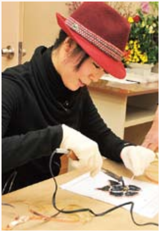
私もステンドグラス作り中、手作り料理の模擬店の出店、音

今回のひらつか~なは、中央公民館で開かれたお祭り「ちゅうおうFESTA」取材しました。