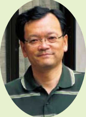
落合克宏市長が自己紹介を書きました。