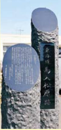
「東海道馬入松原跡」の碑

馬入地区の歴史を調査・研究している、馬入の歴史連絡協議会が松原公民館に「東海道馬入松原跡」碑を建てました。平成18年から始まった馬入地区の歴史を伝える碑は、