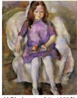
油彩・キャンバス 1925年

独特な軽さと微妙な輝きを放つ画面は、パスキン晩年の作品の特徴で、「真珠の光沢」と呼ばれました。 (文)平塚市美術館学芸員 江口 【美術館 ☎3521111】 「花ひらくエコール・ド・パリの画家たち」(日程などは左上欄で展示しています)。