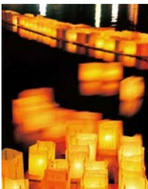
平和を願う灯籠流し

平和への願いを込めた灯籠流しやキャンドルの点灯、戦中・戦後をしのぶ「すいとん」の試食、高校生のコーラス、平和の大切さを呼び掛け