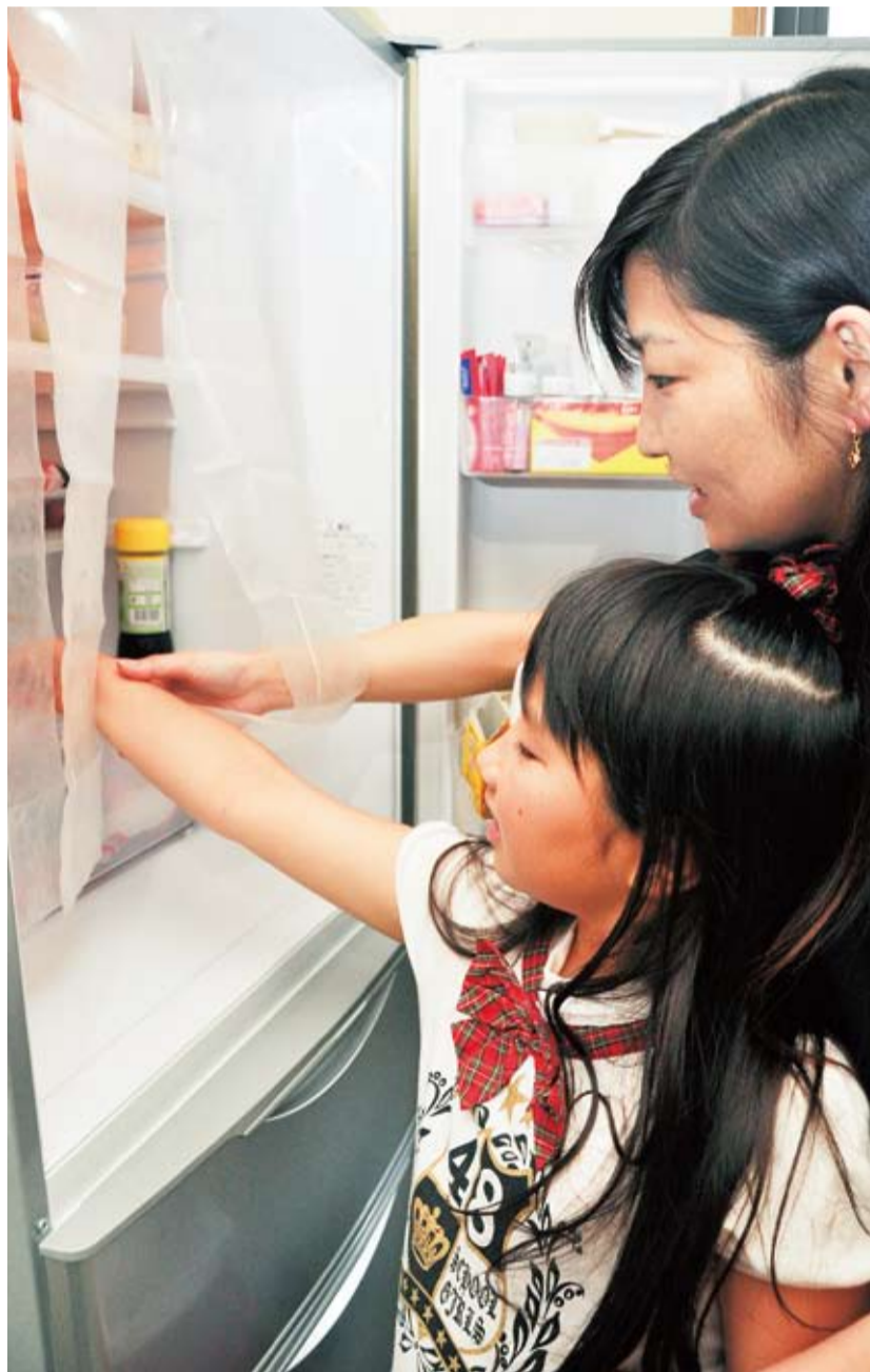
冷蔵庫内に貼ったビニールのシートで冷気を逃しません

冷蔵庫です。冷蔵庫はテレビや照明などとは異なり、いつもスイッチが入った状態になっています。