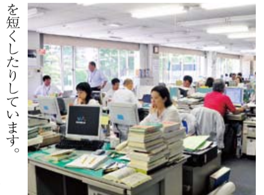
照明を間引き、自然光で明るさを確保