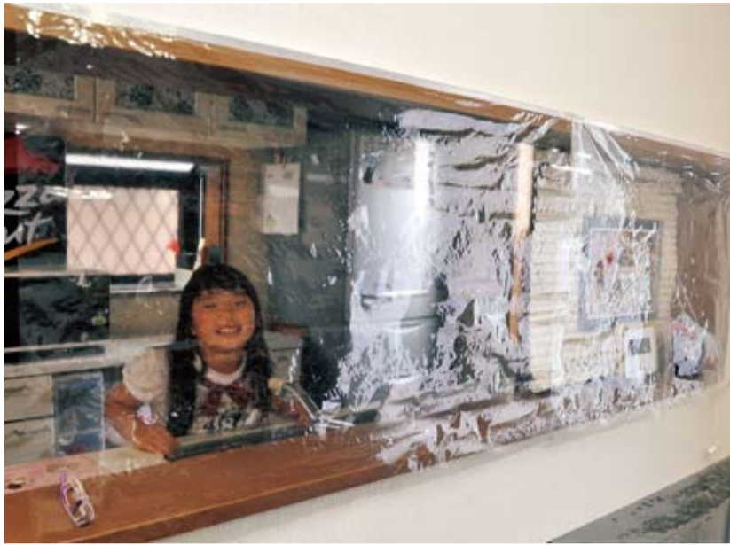
空気の入出りを遮断して室温を保つビニールのカーテン

総合体育館の施設利用時間を変更し、スポーツサウナは午前11時～午後6時とします。7月19日(火)と7月25日～8月29日の月曜日は温水プールの利用を午前9時30分～午後5時30分(入場は午後5時まで)とします。球場は予約済のものを除き午後6時～10時のナイター利用を制限します。