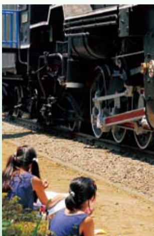
蒸気機関車を写生する子どもたち

市内にある昔の道具や古い建物、土器などの遺物、D52型蒸気機関車を題材にした作品を募集します。中学生以下の方。四つ切りサイズの画用紙(一人1点)。 D52型蒸気機関車写生会 7月22日(金) 午前9時30分～午後3時。文化公園(浅間町5-1)の博物館南側のD52型蒸気機関車周辺。雨天の場合は青少年会館。持ち物は絵の具・クレヨンなど。 作品の裏面に 必要事項 ・年齢・学校名・題名を記入し、7月29日(金)までに 社会教育課 ☎35-8124へ。