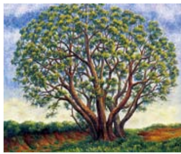
1965年(昭和40) 油彩・キャンバス

群馬の赤城山にあるミズナラを描いたこの作品は、1973年に第1回美術ジャーナル賞を受賞しました。太い幹からこずえまで同じトーンとタッチで描き込まれ、まるで生きていくかのようなうねりと迫力を見せています。