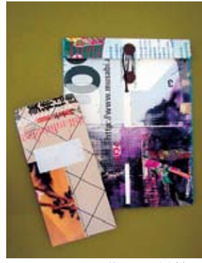
ポスターで作った封筒

①大人のための版画講座2 タイルグラフィックで作るオリジナル・カード... 10月30日(日)午後1時30分～4時