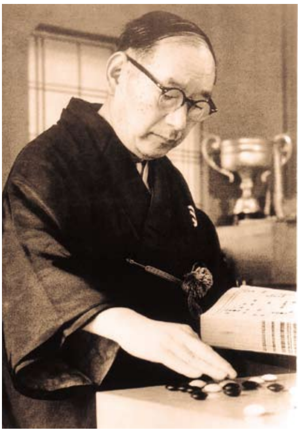
木谷實(明治42年〜昭和50年)近代囲碁の革命といわれる「新布石」の考案や多数の弟子の育成などで囲碁界に功績を残した。

これまでは、徳川家康や本因坊秀哉名人らが果たした囲碁殿堂入り。木谷實は12人目に当たります。殿堂入りを記念し、市ではパネル展などを実施します。木谷實の輝かし