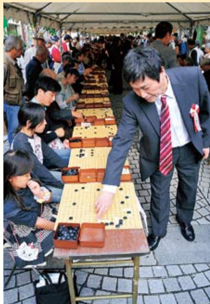
1000面打ちでプロ棋士と対局を