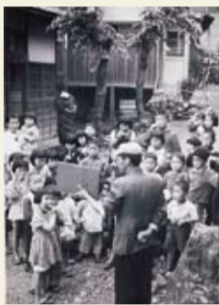
昭和28年頃。現在の見附町付近。

1月6日〜5月31日に博物館 ☎33-5111へ直接お持ちいただくか、電話で連絡を。