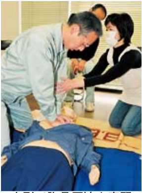
人形で胸骨圧迫を実習

「肘を伸ばして押しましょう」。講師の応急手当普及員が、すつと肘を支えてコツを伝授します。「腕だけで押すよりも疲れにくいんです。いざというときに、長く続けられます」。12月9日、恒例の普通救命講習会が消防本部で開かれ、約20人が受講