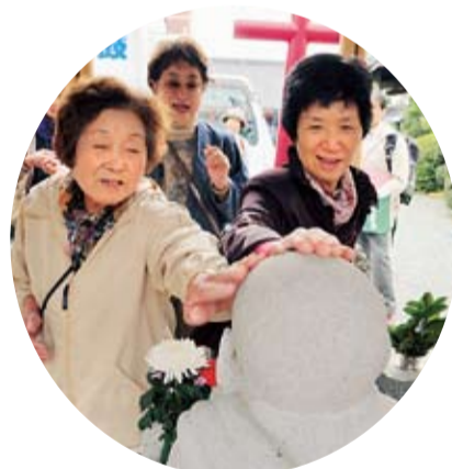
布袋尊をなでてニコリ

「きれいなねえ」。相模川河口の堤防を上ると広がる、川と海が溶け合う景色に歓声が上がりました。「ここが平塚八景の一つ、湘南潮来(9)です」と解説する