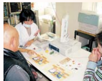
栄養相談で食生活見直し

と、脳卒中や心筋梗塞が起きたり、透析が必要になったりしてしまふことがあります。健康診断で、肥満・高血圧・高血糖・脂質異常・腎機能障害・タンパク尿などを指摘されたら、内科を受診してみてください。早めに適切な治療や栄養相談を受けて、食生活を見直すことで、病気の進行を遅らせることができます。