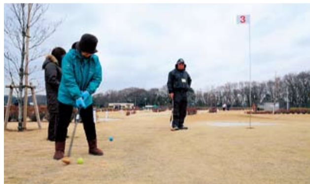
気軽にパークゴルフを楽しんでみませんか

市民パークゴルフ教室 一昨年オープンした湘南ひらつかパークゴルフ場(上吉沢1579)で、プレーをしながら基本的なルールやマナーを学ぶ教室を開きます。道具は無料で貸し出します。底が平らな運動靴と、動きやすい服装でお越しください。 ①3月9日(金)②16日(金)③19日(月)④23日(金)⑤26日(月)、午後2時～5時。雨天またはコースの状況により中止する場合があります。市内在住で、パークゴルフ未経験の方、各20人(抽選・一人1回)。 ☎ 往復はがきで、希望日(第2希望まで)・必要事項・年齢を、2月13日(月)までに〒254-0074大原1-1スポーツ課 ☎31-3060へ。