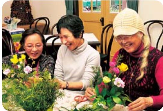
平塚産のバラやカーネーションを使います

欧米では、バレンタインデーに花を贈る風習があります。今年のバレンタインデーは、自分で作ったブーケをプレゼントしてみませんか。バラやカーネーションなど平塚産の花を使ったブーケを作り、カフェで楽しみます。花の即売もします。