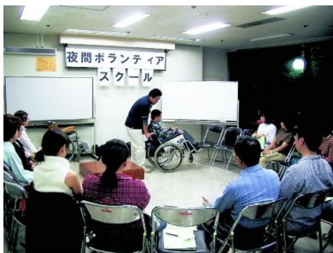
夜間ボランティアスクール