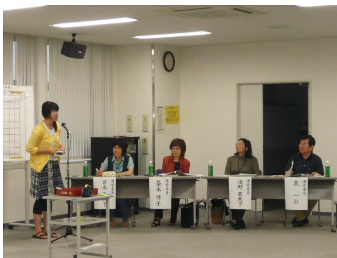
市民活動ファンドの公開審査会