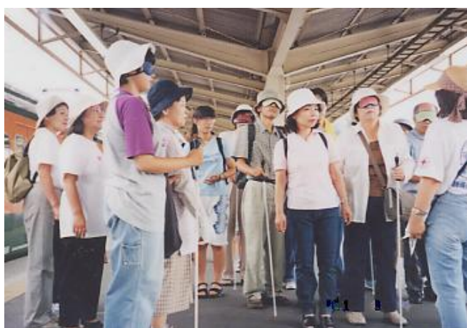
ボランティア育成の講習会