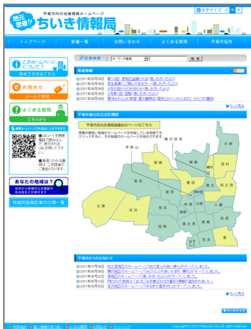
市内の地域情報ホームページ