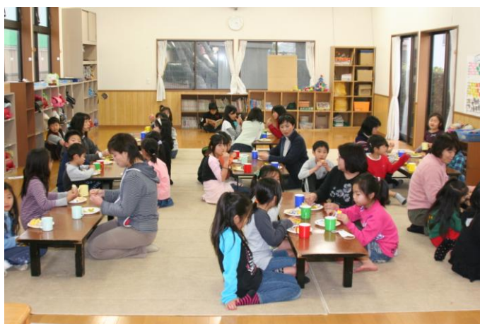
児童の放課後の居場所づくり