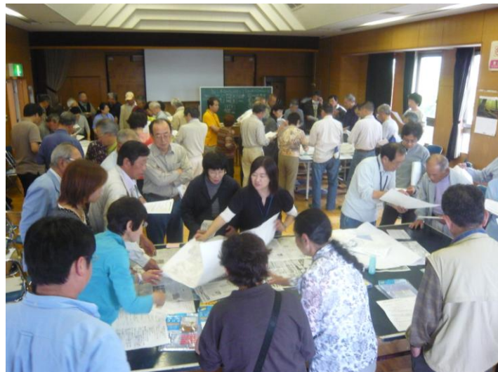
地域の課題解決に向けた取組み