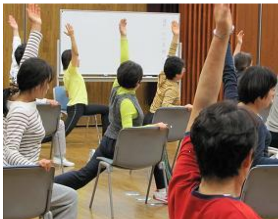
健康増進のためのストレッチ教室