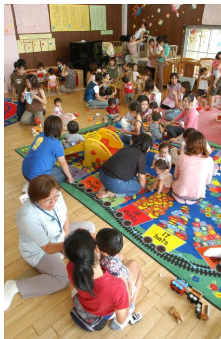
子育て支援センター