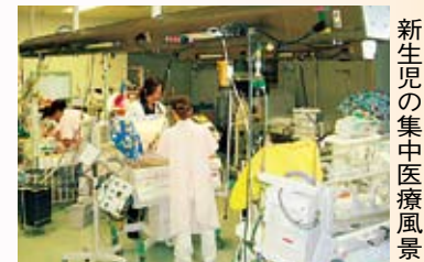
新生児の集中医療風景

も増加しているのが現状です。このため、満床で市内からの受け入れができないことも多く検討が必要と考えています。小児の救急は、一次救急を休日・夜間急患診療所で、入院・検査などが必要な二次救急を病院が担当しています。しかし、当直翌日も通常の勤務があり本院のみでは365日対応することが難しく平塚共済病院・東海大学大磯病院を含めた3病院の輪番制で二次救急に当たっています。