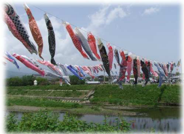
悠々と泳ぐたくさんの鯉のぼり