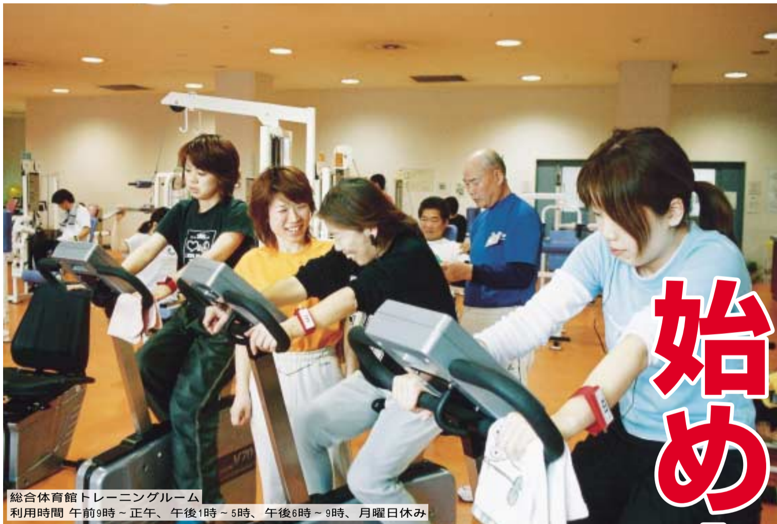
総合体育館トレーニングルーム 利用時間 午前9時～正午、午後1時～5時、午後6時～9時、月曜日休み

検査内容 トレッドミルなどによる運動負荷時の心肺機能、筋力評価装置による筋肉の運動能力や障害の程度など