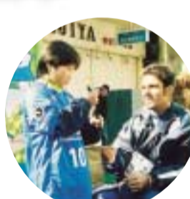
サイン会にサイン選手

3月2日(日) 「ベルマーレワンダーランド2003」 湘南ベルマーレの選手とふれあえる「ベルマーレワンダーランド」。会場の平塚駅北口中心商店街には、多くのファンが集まり、スタンプラリーやサイン会など、あこがれの選手と一緒に楽しい一時を過ごしました。 」1昇格めざして、ガンバレ!