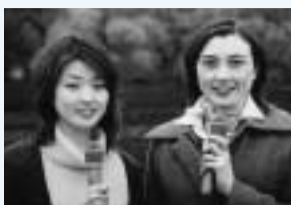
新アナウンサー(左)二人

SCN 湘南チャンネル(2ch) TAIKEN通信 若い男女2人が、交通安全をPRするために様々な仕事に挑戦します。どうぞ、お楽しみに。 《水・金曜日午後6時30分・10時、土曜日午後1時ほか 20分番組》 くすのきTime 番組の顔として活躍している市民アナウンサー。今月からニューフェイスの登場です。子どもたちに大人気のポリケン君が登場する「交通安全コーナー」など、内容もリニューアルして盛りだくさんの情報をお届けします。ぜひ、ご覧ください。 《月～土曜日午前7時30分・午後6時・10時30分ほか 20分番組》 問 広報課(☎21-8761)