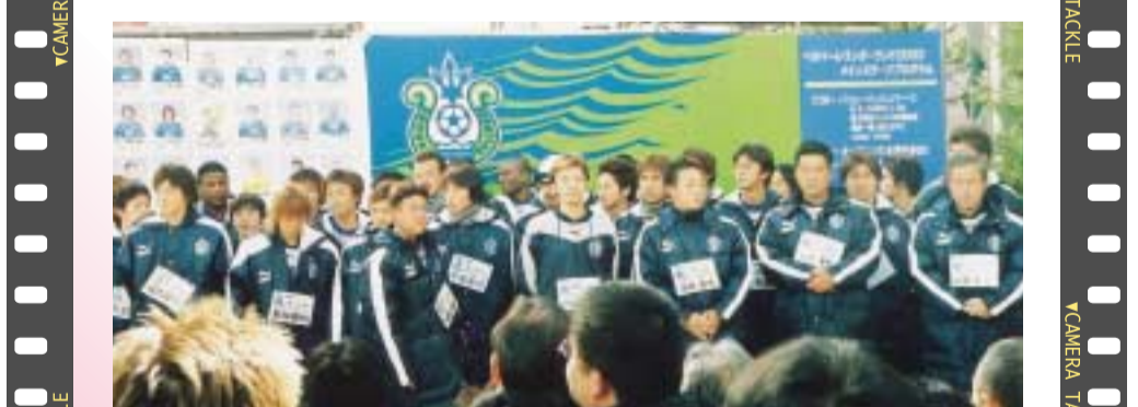
応援、よろしくお願ひします