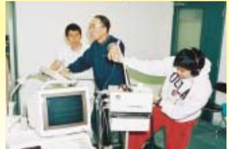
トレッドミル検査

検査内容 トレッドミルなどによる運動負荷時の心肺機能、筋力評価装置による筋肉の運動能力や障害の程度など