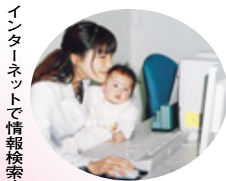
インターネットで情報検索も