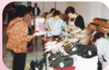
いいものずっと大放出

産業まつりで好評の「みつけ市」が市民プラザに初登場。「ずっと」そろったお買い得品や掘り出し物を求めて、連日たくさんの人でにぎわいました。