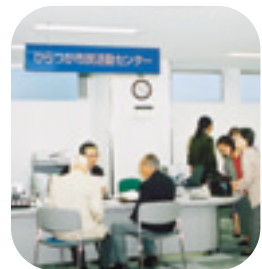
利用の申し込みはこちら

平塚駅南口J Aビルかながわ2階に、市民活動センターと消費生活センターがオープンしました。市民活動センターには、市民の方々の活動を支援する様々なスペースがあります。どうぞ、ご利用ください。