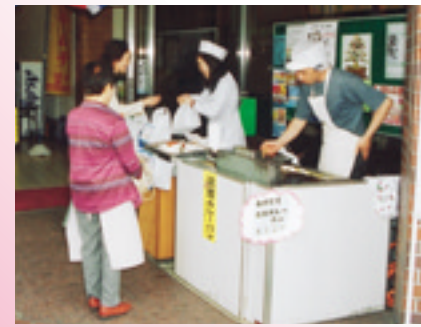
大人気の弦斎カレーパン