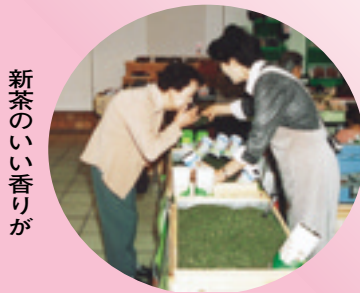
新茶のいい香りが