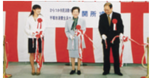
オープンを記念してのテープカット