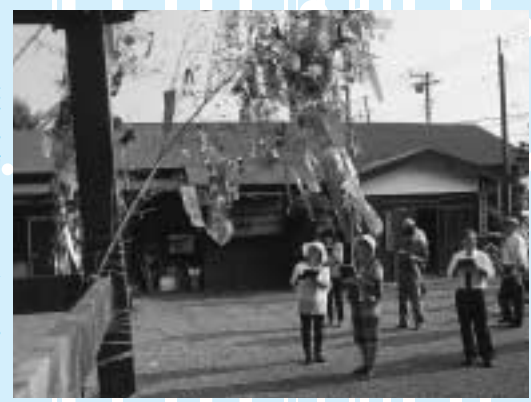
地域の竹飾りもすてきですね。