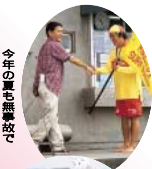
今年の夏も無事故で

みんなが楽しみに待っていたビーチパークの海開き。頼もしいライフセーバーに見守られながら、輝く太陽のもと、いち早く「湘南の夏」を満喫しました。