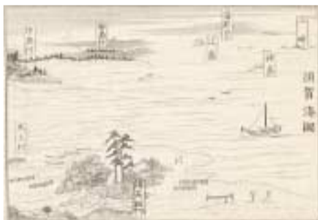
江戸時代末の須賀湊 (新編相模国風土記稿)

鉄道ができるまでの物流の主役は水運(舟運・海運)です。相模国のほぼ中心に位置した須賀湊には、相模川を利用して、流域の村々から年貢米や炭、薪、材木などが運ばれました。遠くは山梨県の都留地方からも物資が運ばれ、運搬には、いかだや大きな帆を広げた高瀬舟が利用されました。