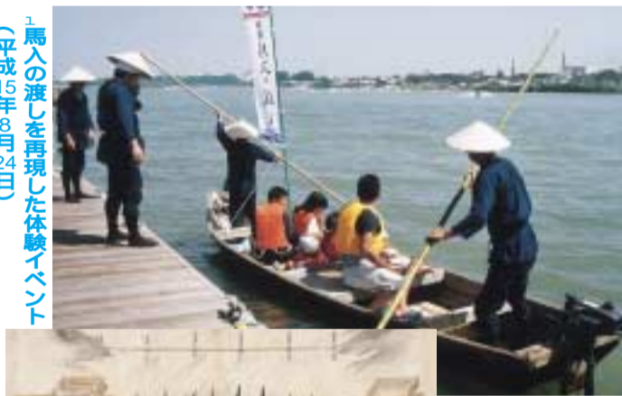
「馬入船橋絵図」 (平塚市博物館蔵)

江戸時代、幕府は大きな河川に橋を架けることを禁止しました。そのため、相模川や多摩川は「渡し船」、酒匂川は「徒歩渡し」などで渡っていました。相模川には六十か所以上の渡し場があったといわれます。そのうち、東海道の部分は「馬入の渡し」と呼ばれ、幕府が管理し、周辺村々の負担に よって成り立っていました。当初、船の用意は須賀村だけで対応していたようですが、元禄五年(一六九二年)に对岸の柳島村が加わりました。また、渡船賃の徴収などを扱う「川会所」の運営や船頭の確保は、馬入村など五か村が務めました。渡し船には「小舟」と「馬船」があり、小舟は人を乗せる船で定員二十人ほど、馬船は大型で馬が荷物を積んだまま横向きに