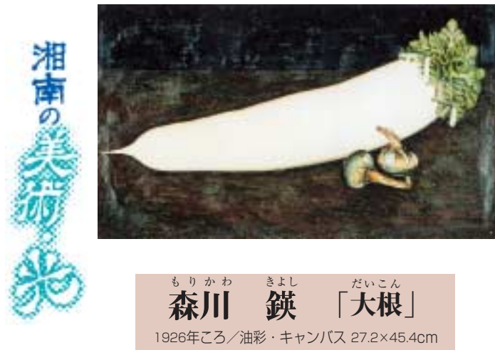
もりかわ きよし だいこん 森川 鉄 「大根」 1926年ころ/油彩・キャンパス 27.2×45.4cm

やみに包まれた机の上で大根が真っ白な肌を浮かび上がらせ、添えられたくわいと共に冬の季節感を感じさせます。