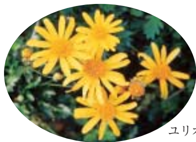
ユリオプレステージ

●発行 平塚市 ●編集 企画部広報課 〒254-8686 神奈川県平塚市浅間町9番1号 電話 23-1111・35-1111 FAX 23-9467 http://www.city.hiratsuka.kanagawa.jp/ ●発行部数 100,000部 (毎月1日・15日発行)