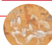
▲仰向けになった象が描かれています。