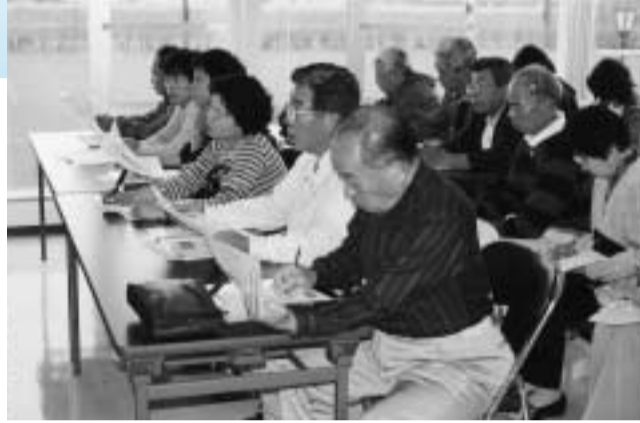
研修や施設見学など、市政について熱心に学ぶ市政モニターのみなさん

市民のみなさんから市政に対するご意見やご要望をお聞きするため、市政モニターを募集します。市の行政施策などに関心のある方は、ぜひ、この機会にご応募ください。