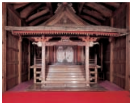
▲北金目神社本殿。左右の柱から突出した部分に象の彫刻があります。