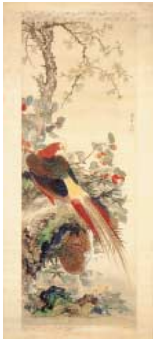
起した手足、鋭いつめなどの描写の表現も華麗さを極めています。

おかもと しゅうき 岡本 秋暉 きんけいちゅうき 1807年/綱本看色/97・0・X35・0・cm 神奈川県立歴史博物館蔵