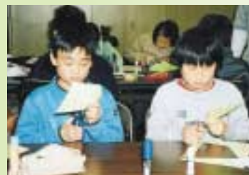
楽しい数学教室 数字のマジックおもしろいね!