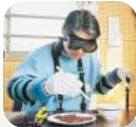
3月14日(日) ひらつか市民・大学 交流フェスタ2004

平塚にキャンパスがある東海大学・神奈川大学の知識や技術を学ぶ交流イベント。各大学の教授を講師に迎えたスポーツ、科学、福祉などの講座にたくさんの方が参加しました。