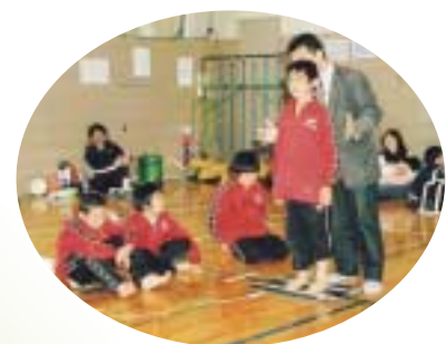
ベルマーレスタッフによる足裏の重心測定