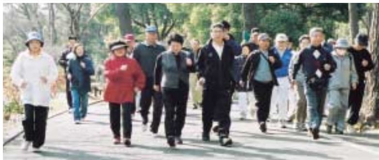
ウォーキングは健康づくりの第一歩