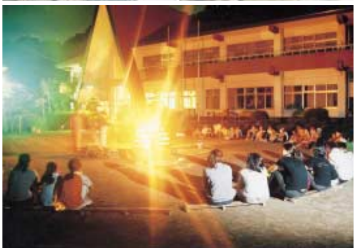
▲昨年8月にびわ青少年の家で開いた「チャレンジキャンプ」。火起こしから野外炊事、キャンプファイアなど、楽しみがいっぱいです。