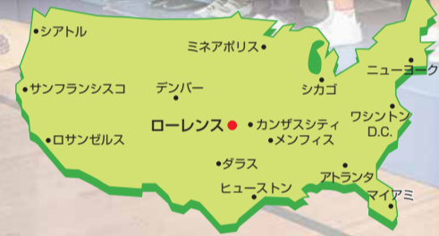
ローレンス市はカンザスシティの西50kmに位置