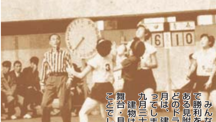
①第10回国体でバスケットボールの会場に②昭和37年、第10回平塚市文化祭③昭和40年、市内全2,500人の中学2年生を集めた立春日