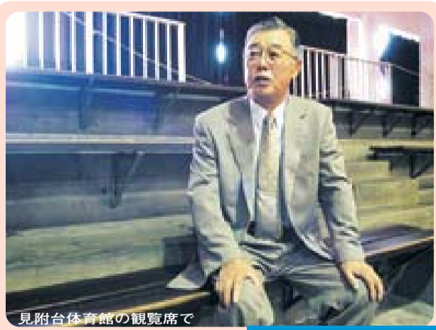
見附台体育館の観覧席で

●ひらつかアリーナへ 見附台体育館の機能の大部分は八月に完成した「ひらつかアリーナ」(馬入)へ受け継がれます。十月から本格稼働する「ひらつかアリーナ」もどうぞ、ご利用ください(利用方法は、馬入ふれあい公園管理事務所・☎25-100011へ)。