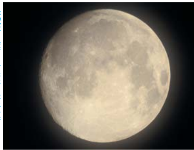
博物館から撮影した十五夜の月(平成三年)