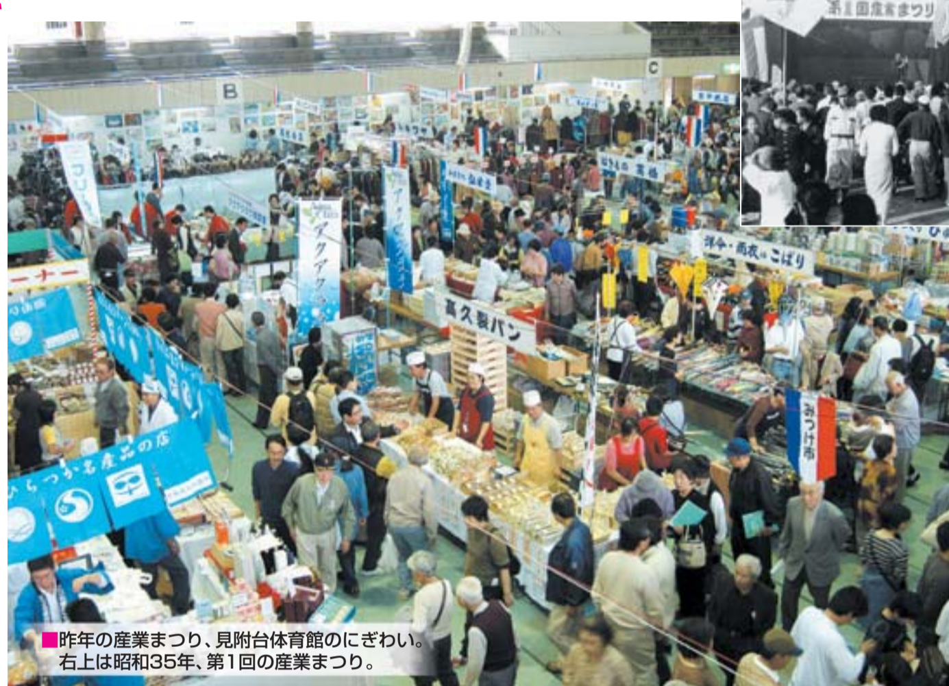
■昨年の産業まつり、見附台体育館のにぎわい。右上は昭和35年、第1回の産業まつり。