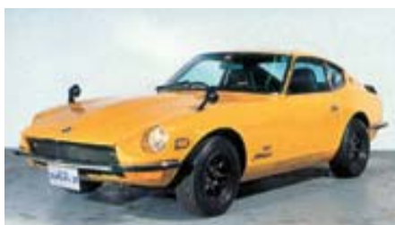
▲日産フェアレディZ432(色は展示車両と異なる場合があります)

お問い合せは、環境政策課(内線2655)へ。 環境政策 お問い合せは、環境政策課(内線2655)へ。