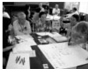
グループに分かれて話し合い、検討を繰り返します。