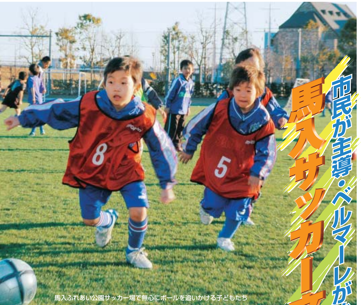
馬入ふれあい公園サッカー場で無心にボールを追いかける子どもたち

バス 平塚駅北口 9 番線から東八幡工業団地行き「工業団地入口」下車徒歩5分または、4番線茅ヶ崎駅行き「馬入橋」下車徒歩10分、大人片道170円