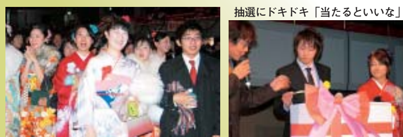
抽選にドキドキ「当たるといいな」