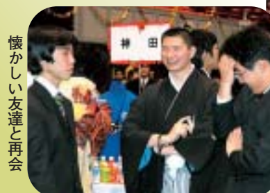
懐かしい友達と再会