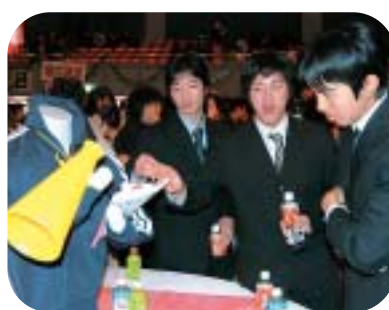
テーブルの上には母校の体操着

今年、成人の仲間入りをしたのは3,216人。当日の式典には2,238人が参加し、出身学校別のテーブルに分かれた会場で思い出話を花を咲かせていました。式典後は、新成人から募った実行委員会によるアトラクションがあり、恩師からのビデオレターや記念抽選会など、楽しく和やかな雰囲気に包まれながら大人としての第一歩を踏み出しました。