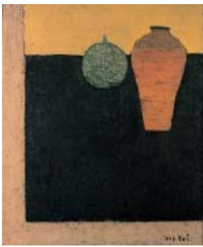
鳥海青児「伊賀瓶」とメロン」 1957年／油彩・キャンバス／72・8×60・2cm

2月1日(火)～28日(月)、午前9時～午後5時(土・日曜日、祝日を除く)／平塚本宿郵便局／入場無料／岡府川義辰(☎)5665