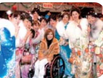
抽選にドキドキ「当たるといいな」