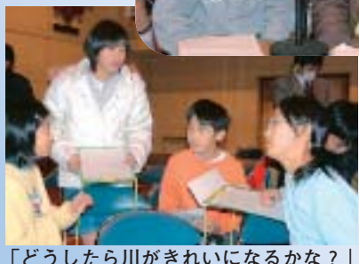
「どうしたら川がきれいになるかな？」