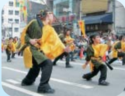
踊るのはとても楽しいよ

豪華絢爛な竹飾りは色彩豊かで、今年話題を集めた二本足で立つレッサーパンダなどの飾りが注目をあびていました。また、願いごとを短冊に託す人の姿が見られ、たくさんのイベントに大勢の人たちが参加して華を添える素晴らしい七夕まつりになりました。