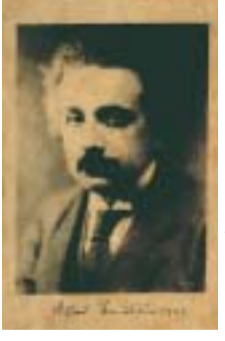
アインシュタインの直筆サイン入りプロマイド (一九二三年・鈴木剛さん(長持)所有)