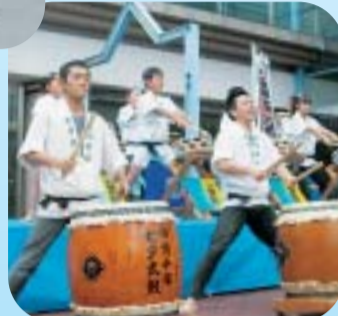
迫力ある七夕太鼓の演奏