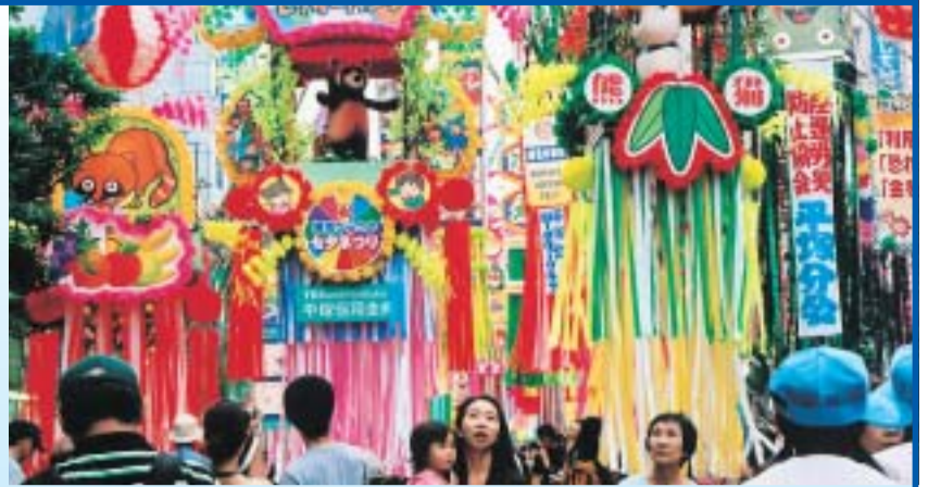
平塚のまちを彩る竹飾りはおよそ3,000本