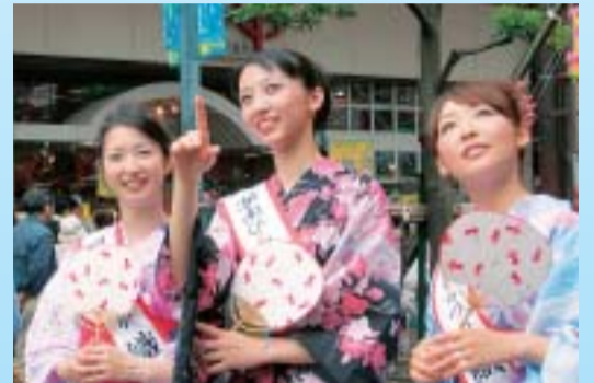
3人の織り姫が七夕まつりを盛り上げました