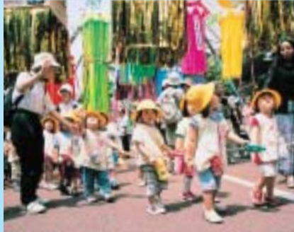
今年はどんな飾りがあるのかな