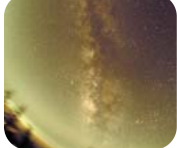
八月の星空・中央に見えるのが天の川です

二〇〇五年は国際連合が定めた世界物理年。これは、二十世紀の偉大な科学者アルベルト・アインシュタインが、特殊相対性理論など革命的な三つの論文を発表した一九〇五年から百年