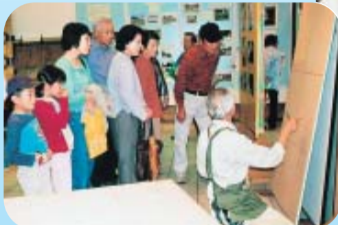
ふすまはこのように張り替えるんですよ