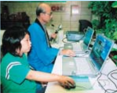
操作の仕方を特訓中