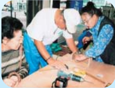
いすの完成までもう少し

ふすまの張り替えの実演、正座らくらくいす作りの体験、パソコンによる折り紙教室などに、参加した人たちは会員の指導のもと、ひとつひとつ出来上がっていく過程に喜びを感じていました。