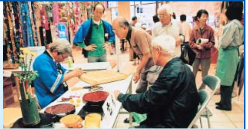
盛りだくさんのイベントに毎日大にぎわい