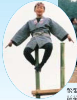
緊張に包まれながらのはしご乗り「二本腹亀」(上)と「一本遠見のくずし」(左)