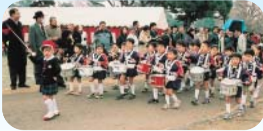
子どもたちも出初式を盛り上げました