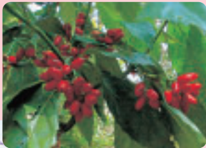
鮮やかに色づいたアオキの実