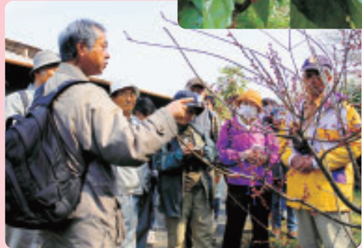
「サクラ」と違い、花に柄がないのが「ウメ」です

悲しいことに、山の中でごみが散乱しているところがありました。自然はみんなでも守りたいものですね。