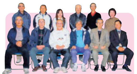
この公園を地域のオアシスのような存在に 桜ヶ丘公園管理運営委員会のみなさん

園内には、公園周辺地域に住むみなさんや公募で集まったみなさんの意見を反映して作った