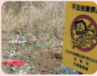
捨てられたごみは里山も泣いています