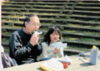
外で食べるお弁当もおいしいね