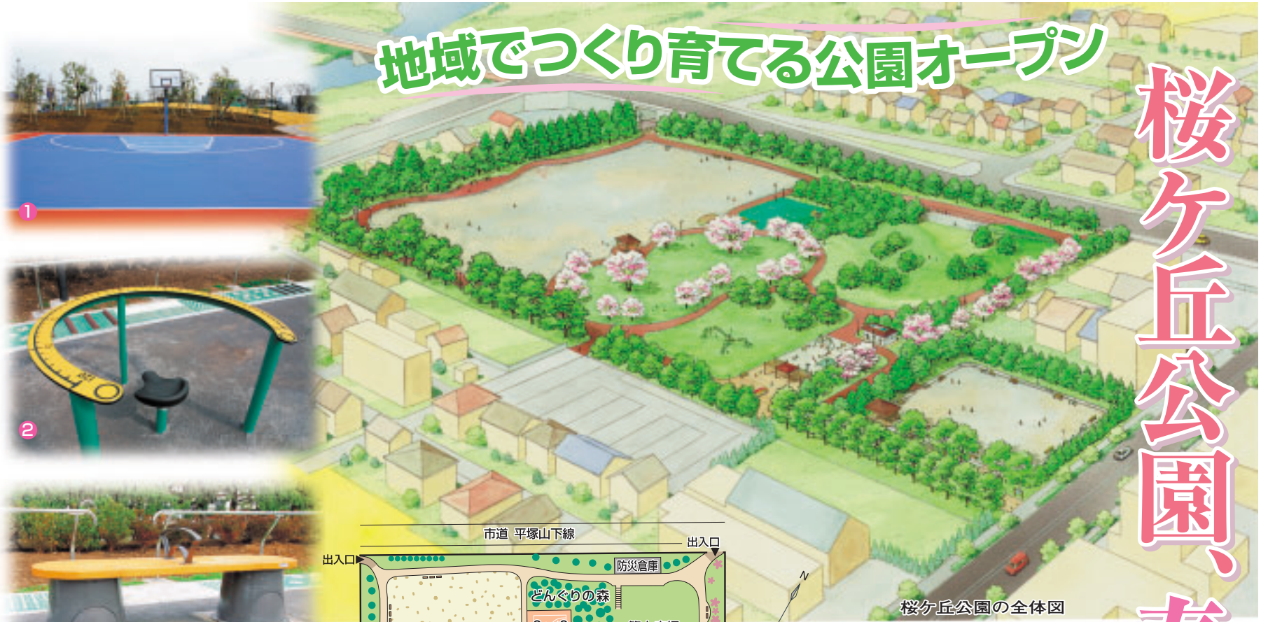
桜ヶ丘公園の全体図