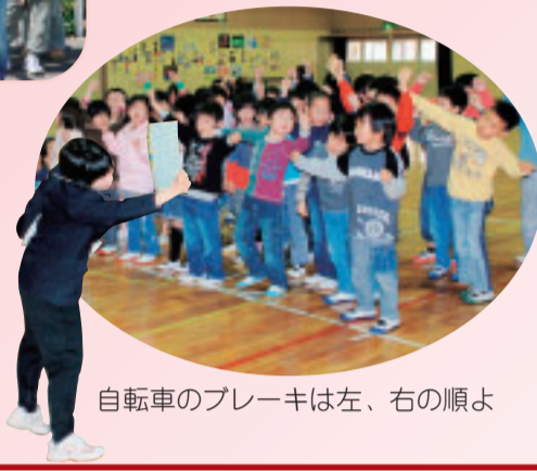
自転車のブレーキは左、右の順よ