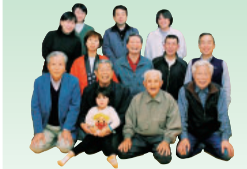
鈴川鯉のぼり祭り実行委員会のみなさん

鯉のぼりを揚げてお祭りを開催している場所は全国に数多くあります。でも、富士山を背に鯉のぼりが泳ぐ風景が見られる場所はなかなかありません。連休中には催しも予定していますので、ご家族で楽しんでください。