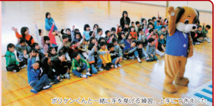
ポリケンくんと一緒に手を挙げる練習。上手にできました