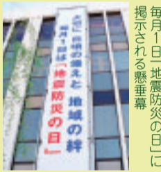
毎月1日「地震防災の日」に掲示される懸垂幕

なお、最優秀賞に選ばれた作品は、平塚ラスカに懸垂幕で掲示するなど防災啓発事業に活用します。