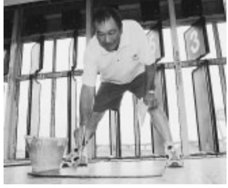
自分が担当したチームが負けるととっても悔しいですね。

平塚球場のスコアボードの文字書きを20年近くやっています。真剣に野球に打ち込む高校球児からは勇気と元気をもらいます。実は、妻は球場の場内アナウンスをしています。恥ずかしながら、同じ試合を担当することもあるんですよ。夫婦円満が健康の秘けつといえれば秘けつでしょうか。