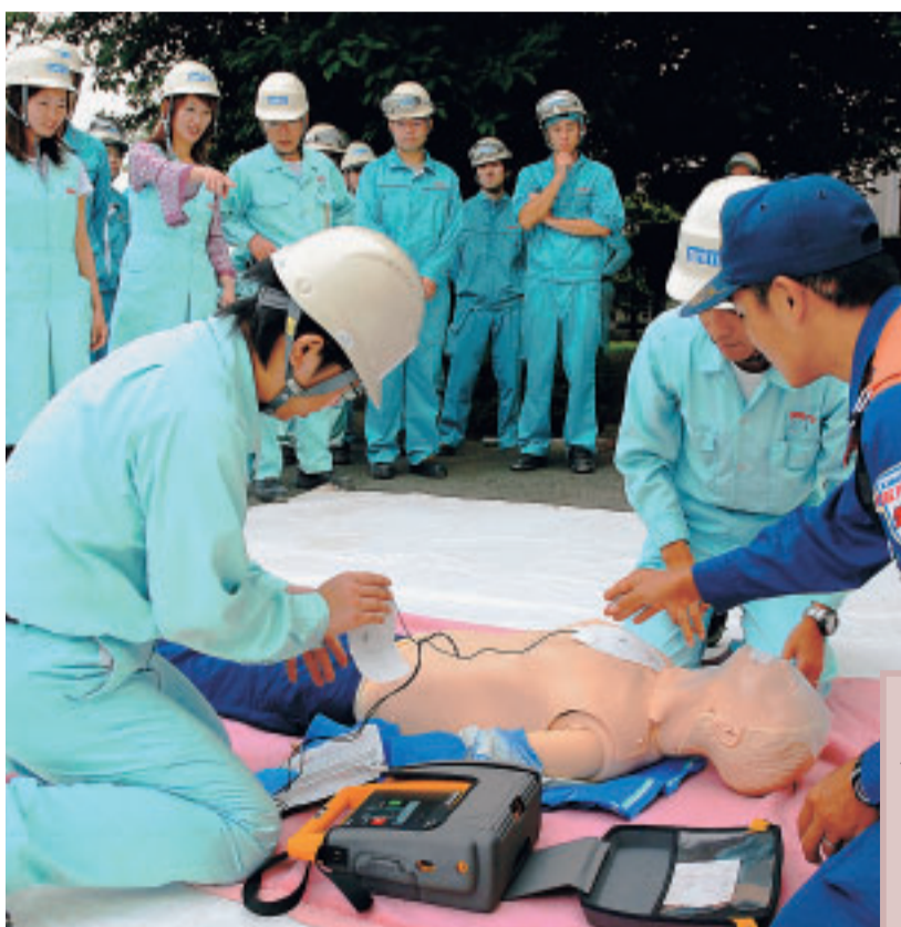
AED(自動体外式除細動器)を使って心肺停止者を救助 市内の企業が実施した防災訓練。みなさんも災害に備えて地域の防災訓練などに積極的に参加してください。