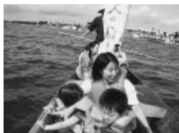
のんびり川を渡ります