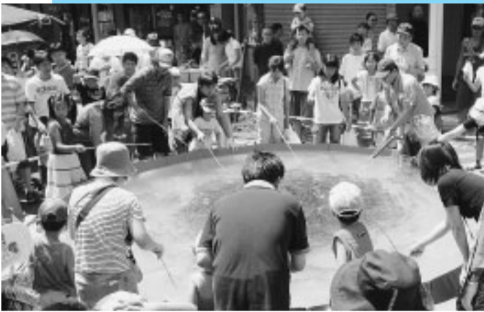
黒潮つり大会では、アジやマダイやハマチなど、1000匹の魚が水槽に放されます。みなさんも大物を釣り上げてみませんか。

楽しいイベントや昔懐かしい屋台で、過ぎ行く夏のひとときを盛り上げます。勇壮な太鼓の演奏が会場に響き渡り、直径4.5mの特設水槽には1000匹の魚を放ち、釣り大会を開きます。また、まちかど広場に巨大スクリーンを置き、湘南ベルマーレの試合を生中継して、J1昇格を目指すベル