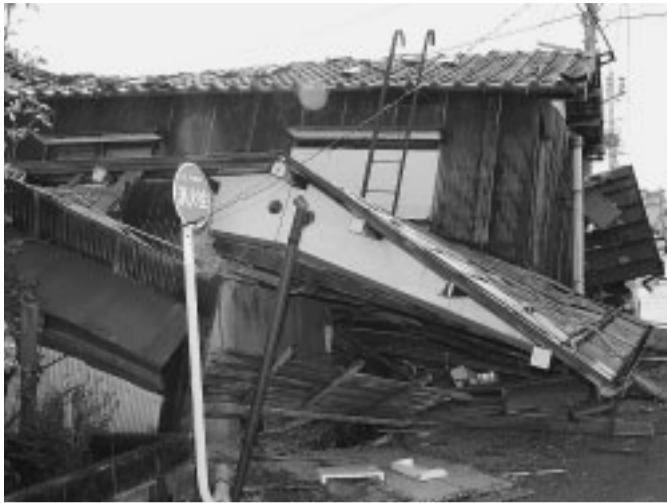
平成16年10月に発生した新潟県中越地震により倒壊した家屋

地震の被害を完全に防ぐことはできません。しかし準備をすることで被害を少なくすることはできます