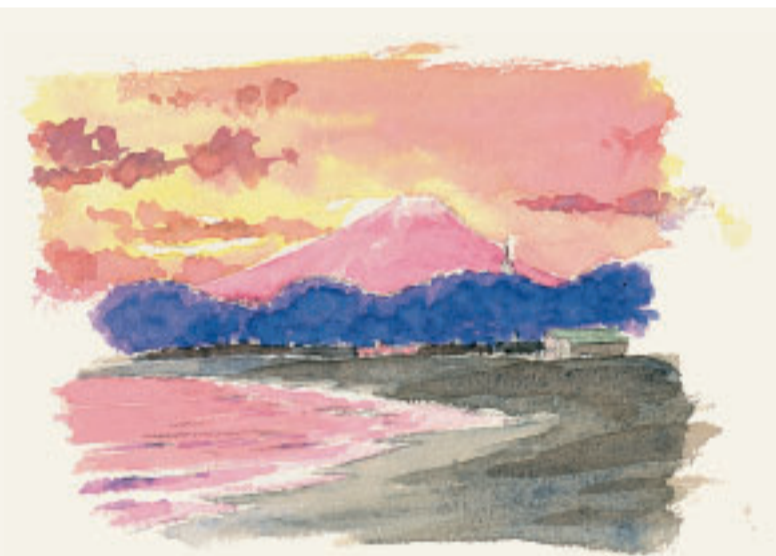
季節をめぐるまち歩き 絵まきのこうじ