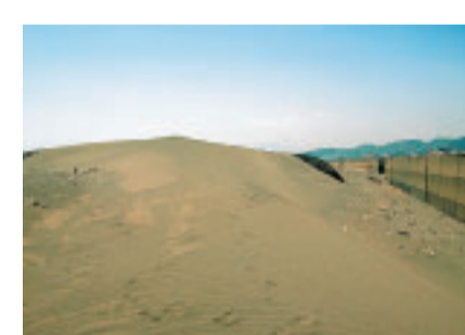
風紋の見える平塚の砂丘 (1980年ごろ・虹ヶ浜)

かつての海岸線を物語るもの 相模川河口から花水川河口へ至る平塚海岸。そこには、砂浜に平行して砂丘の高まりが続き、背後に松林のくぼ地が延びています。 砂丘は、潮流によって運ばれた砂が砂州をつくり、それが風に飛ばされて、高く積りました。 平塚の市街地を南北に歩くと、平たんに見える街にも高まり(砂州・砂丘)や、東西に延びるくぼ地がたくさんあることがわかります。例えば、平塚市役所はくぼ地に、博物館は砂州の上にあります。また、平塚八幡宮や中原の日枝神社、真土神社などがある場所にはさらに標高が高く、砂州の上に砂丘が重なっています。 平塚で最も北にある砂丘は、海岸から5キロも離れた豊田八幡宮のある場所にあります。 砂丘は海岸にできるものから、このような砂丘の分布は、かつての海岸線の変化を示していることになりました。平塚の市街地には十数列の砂州・砂丘列があります。これは今から約5千年前以降、海岸線が次第に前進していく過程で形成されました。ちなみに、東海道線付近が海岸線だったのは、今から約2千年前のことです。 大地は、土地の隆起や沈降、河川からの土砂の流入、波浪などにより、幾度となく浸食とたい積が繰り返され形成されてきました。平塚の地も、このような数千年の歴史の中でつくられてきたのです。 ◆担当 博物館 ☎33-5111