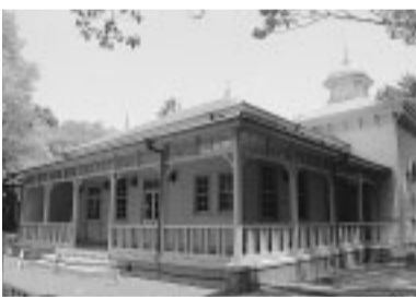
数々の歴史を刻み込んだ記念館

平塚の歴史が刻み込まれた建物が多く、市民に愛されるように、わかりやすく親しみやすい愛称を募集しま