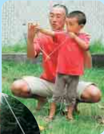
お父さん、弓はこう引くの? そうだよ