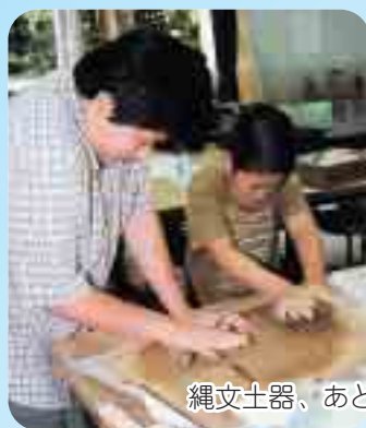
縄文土器、あと少しで完成だ!