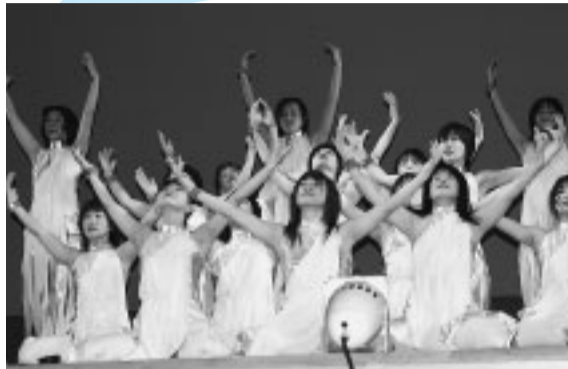
1年間の活動成果を発表します。ぜひ、ご来場ください

中央公民館利用団体による歌や踊り、マジックなどの多彩なステージと、絵や写真、木彫りなどの作品展示をする「ちゅうおうFESTA」を開きます。一般の人が参加できるマジックや木彫りなどの体験教室、おしるこなどの模擬店もあります。 ◆問い合わせ先 中央公民館(☎34-2111) 【主なイベント】 ▽ステージ フラメンコ、舞踊、マジック、大正琴、ヴァイオリン、合唱、詩吟 ▽作品展示 水彩画、絵手紙、生け花、写真、木彫り、掛け軸、和紙人形 ▽体験教室 ●1月30日 シャンソン、折り紙、太極拳 ●1月31日 ステンドグラ、アルトホルン、マジック、木彫り、山岳入門、ハワイアンダンスなど ●2月1日 木彫り、謡曲、山岳入門、折り紙など