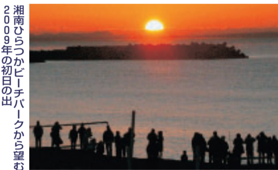
湘南ひらつかビーチパークから望む2009年の初日の出

午前6時52分、三浦半島の先端付近に少しかかった雲間から、ついに今年初の太陽が顔を出すと、ビーチパークを埋め尽くした数千の人たちから大きな歓声が上がりました。見る見るうちに明るさを増していくオレンジ色の太陽。その雄大な姿を心に刻み、暖かさを体に感じながら、人々はそれぞれ、新しい年の願いを掛けていました。 さて、1月も半ばとなりましたが、日の出の時刻はまだ元日とほとんど変わっていません。日の出が早くなってきたと感じられるのはもう少し先、立春のころからです。 ◆担当 博物館 ☎33-5111