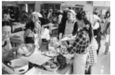
「健康づくりは毎日の食事から」和やかな雰囲気での料理教室

このコーナーでは、平塚市生きがい事業団の会員として、元気に活動している方の健康の秘けつを紹介しています。事業団では、会員を募集しています。詳しくは生きがい事業団(☎33-2335)へ。