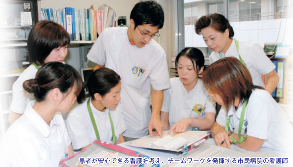
患者が安心できる看護を考え、チームワークを発揮する市民病院の看護師