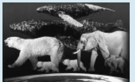
地球の生命体の神秘を描いた「アース」