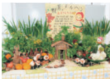
▲食生活改善推進団体ママの会が地元野菜で作ったオブジェ「野菜のメルヘン」

中央公民館2階展示ギャラリーと4階小ホールに、市民団体や企業による食に関する展示・体験コーナーを設けます。時間は2月14日(土)が午後1時～4時、15日(日)が午前10時～午後3時です。15日(日)午後1時30分からは、湘南ベルマーレスポーツクラブ指導員による健康づくり運動教室もあります。ぜひ、ご来場ください。