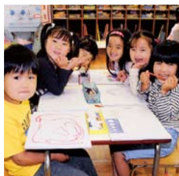
次の世代を担う子どもたち