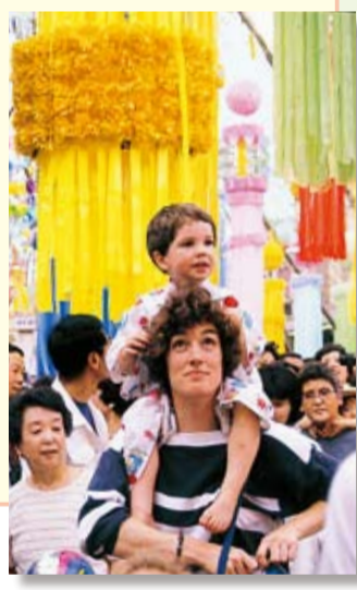
▶七夕の来場者も国際色豊かになってきました

第32回(昭和57年)は平塚が市になってから50年目にあたる年でした。7月1日に中央公民館で市制50周年の記念祝典が行われたのを皮切りに、記念映画会や郷土芸能大会、テレビの公開録画、スポーツ大会やコンサートなどのイベントが約1か月間にわたり実施されました。 7月7日～11日の七夕まつりの期間中はもちろん、8月までおまつり気分が漂う特別な年になりました。