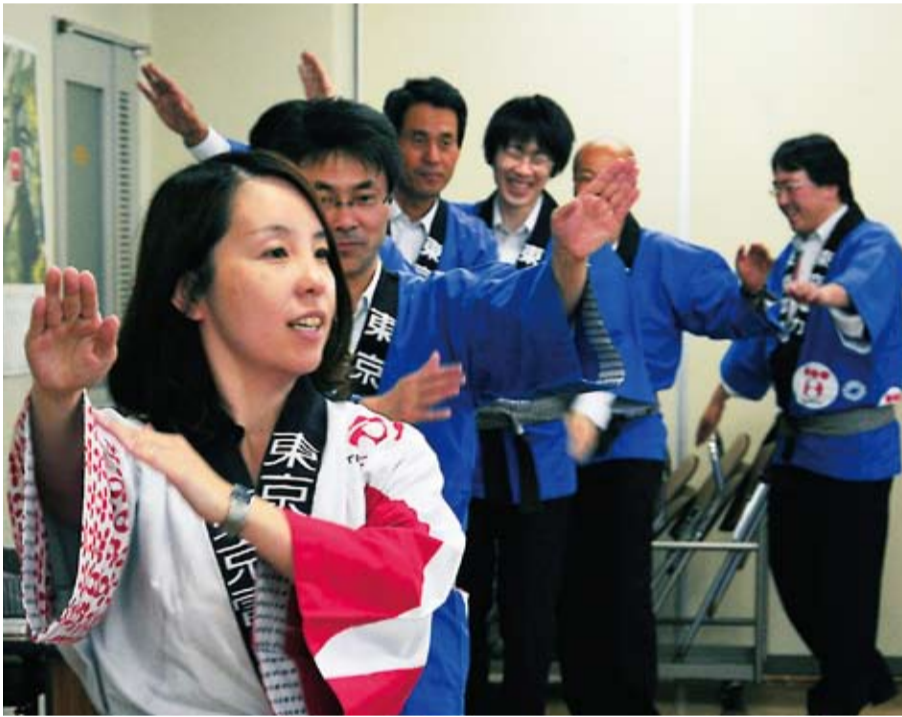
七夕おどりの練習に励む東京電力平塚支社のみなさん

市 内の盆おどりなどでもおなじみの七夕おどり。第2回開催時に平塚七夕音頭が発表されたのを始めに、いくつものおどりの曲が生まれてきました。七夕まつりとおどりは、切っても切り離せない関係です。今では毎年多くの企業や団体が参加する「七夕おどり千人パレード」があり、これは市民総出でおまつりを盛り上げる平塚ならではの催しです。