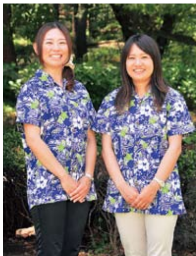
新生アロハで頑張ります