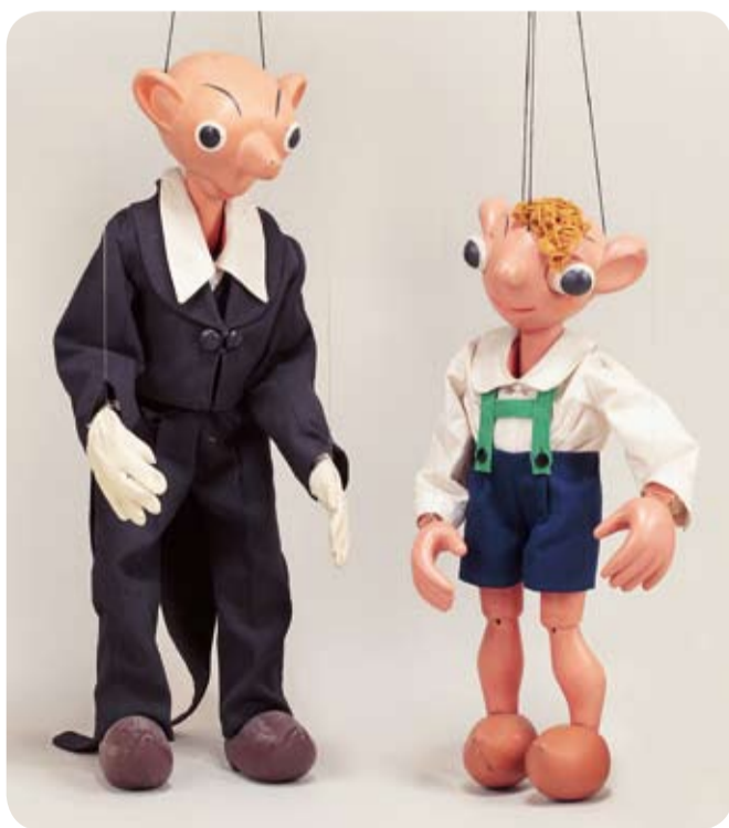
フルジム人形劇博物館蔵

日時 7月17日(土) ～8月29日(日) 午前9時30分～午後6時 (入館は午後5時30分まで)