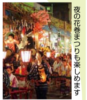
夜の花巻まつりも楽しめます

友好都市花巻市を2泊3日で公式訪問します。ユネスコ無形文化遺産に登録された早池峰神楽も鑑賞します。 ※添乗員が同行します ▷期日 9月10日(金)～12日(日) ▷行程 10日(金)平塚(午前7時出発)→花巻まつり見物→ホテル花巻泊