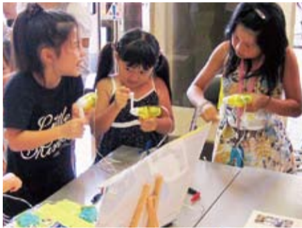
地球温暖化や身近な自然環境の変化などが学べます。夏休みの宿題もここで解決。

日替わりの環境教室やパネル展示などで楽しく学びましょう。 ▷日時 7月22日(木)～27日(火)、午前10時～午後6時(最終日は午後3時まで) ▷会場 市民プラザ ▷内容 太陽光発電やLEDの体験教室、間伐材のコースターと竹笛作