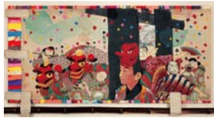
「ぼくがうまれた音」© 智内兄助

7月19日(祝)午後2時～3時、美術館ミュージアムホール 絵本のおはなし会 ※要観覧券 展示されている原画が掲載されている絵本の読み聞かせです。 7月19日(祝)・25日(日)、8月22日(日)・28日(土)、午前11時～11時30分、美術館展示室1