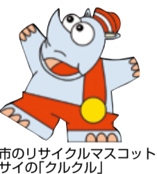
市のリサイクルマスコット、サイの「クルクル」

粗大ごみとして出されたもので再生可能な家具を修理し、希望する市民の方に提供します。 ▷提供個数 50個(抽選) ※一人1点限り。市のウェブに一覧を掲載しています。 ▷展示場所 リサイクルプラザ(四之宮七丁目3-5) ▷展示期間 8月1日(日)～9日(月)、午前9時～午後4時(土日も開館。最終日は正午まで) ▷費用 修理費程度 ▷公開抽選会 8月9日(月)午後2時開始 ▷申し込み 展示期間中に現品を確認の上、申込書をリサイクルプラザ(☎51-5300)へ ▷譲ります・譲ってください 不用品の登録やあっせんは、随時電話などで受け付けています(先着順)。なお、譲り渡しは無償で、交渉は当事者同士でお願いします。 ▷譲ります 学習机、フラインド、電動三輪車 ▷譲ってください ベビーカー、チャイルドシート、パソコンラック、