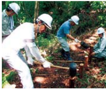
散策路の整備もします

6月9日(土)午後1時〜5時30分。吉沢公民館(上吉沢395)集合。作業に適した服装・靴・帽子で。保険証の写し・雨具。300円。植栽など。