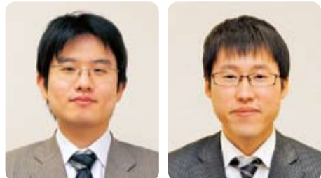
山下道吾本因坊(山下敬吾名人) 挑戦者 井山裕太天元・十段

囲碁タイトル戦の一つ、本因坊戦第5局を6月24日(日)・25日(月)に、平塚プレジール(八重咲町3-8)で開催します。