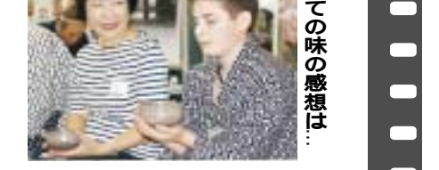
初めての味の感想は...

「24時間ゆめリレーin湘南ひらつか」 走ることが大好きな人たちが総合公園に集合し、24時間や6時間などのリレーに挑みました。個人でも、グループでも楽しみながら走る姿が印象的でした。一つの目標に向かってひたむきに進むことが自分自身の元気のもとです。