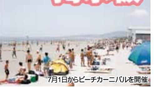
7月1日からビーチカーニバルを開催

楽しくシェイプアップ 女性/毎週金曜日、午前10時~11時30分/大神公民館/月会費二千円/問ジャギーウインクの小屋(55)6952、午後6時以後に舞踏の会へおさそい