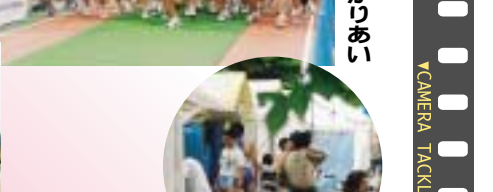
スタートは気合のぶつかりあい

「24時間ゆめリレーin湘南ひらつか」 走ることが大好きな人たちが総合公園に集合し、24時間や6時間などのリレーに挑みました。個人でも、グループでも楽しみながら走る姿が印象的でした。一つの目標に向かってひたむきに進むことが自分自身の元気のもとです。