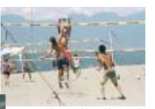
戦いは熱く熱く展開

7月1日(日)～8月31日(金) 「ビーチカーニバル」 夏はやっぱり海が最高。7月15日はスキムボード選手権、20日～22日はビーチバレーボール大会が開催されました。