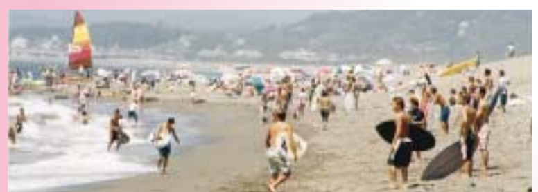
海の遊び方はいろいろ