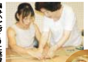
編みかごづくりに挑戦