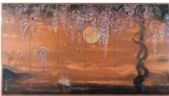
こうめい 近藤弘明「幻光 御感の藤」 1987年/紙本着彩・六曲一隻 164.9×300.1cm

彼岸の世界や観想の世界を描くことが多い作者にとって実景を借景として描いた希少な作品です。