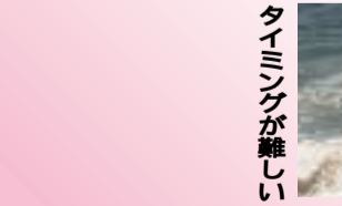
タイミングが難しい