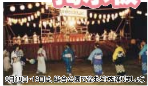
8月18日・19日は、総合公園で盆おどりを踊りましょう