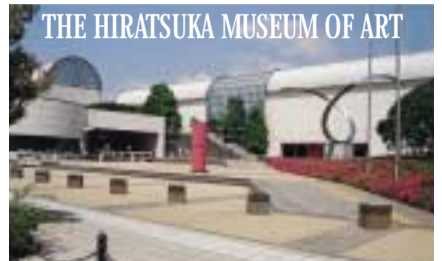
毎週月曜休館 午前9時30分～午後4時50分(入場午後4時30分)

日常生活を離れてほっと落ち着きたいとき、感受性を刺激して別の自分と向き合いたいときなど、芸術が放つ豊かな時空の流れが恋しくなります。多くの人びとの願いを集め、美術館ができて10年。今回、そのなりたちと活動のあゆみを資料や収蔵品でたどります。地域に根付き、美と創造の空間を作り続けている美術館の「これまで」と「これから」を探ってみましょう。 問 平塚市美術館 ☎35-2111)