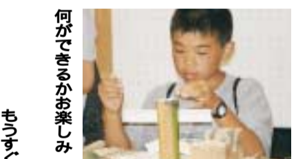
何ができるかお楽しみ

7月1日(日)～8月31日(金) 「ビーチカーニバル」 夏はやっぱり海が最高。7月15日はスキムボード選手権、20日～22日はビーチバレーボール大会が開催されました。