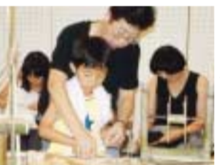
うまく削れるかな

7月19日(木)～24日(火) 「七夕竹細工工房」 七夕まつりで使った竹を利用して、竹細工工房が開かれました。みなさんは思い思いの作品づくりに大忙しです。